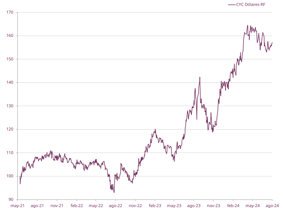
EVOLUCIÓN DE CUOTAPARTE DESDE INICIO