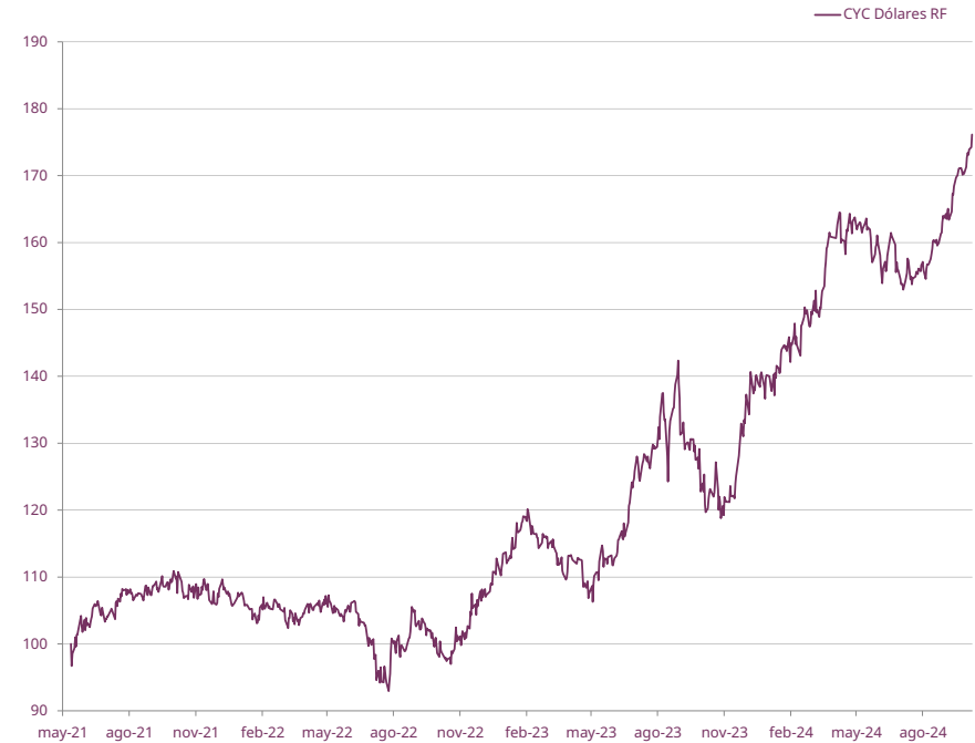
EVOLUCIÓN DE CUOTAPARTE DESDE INICIO