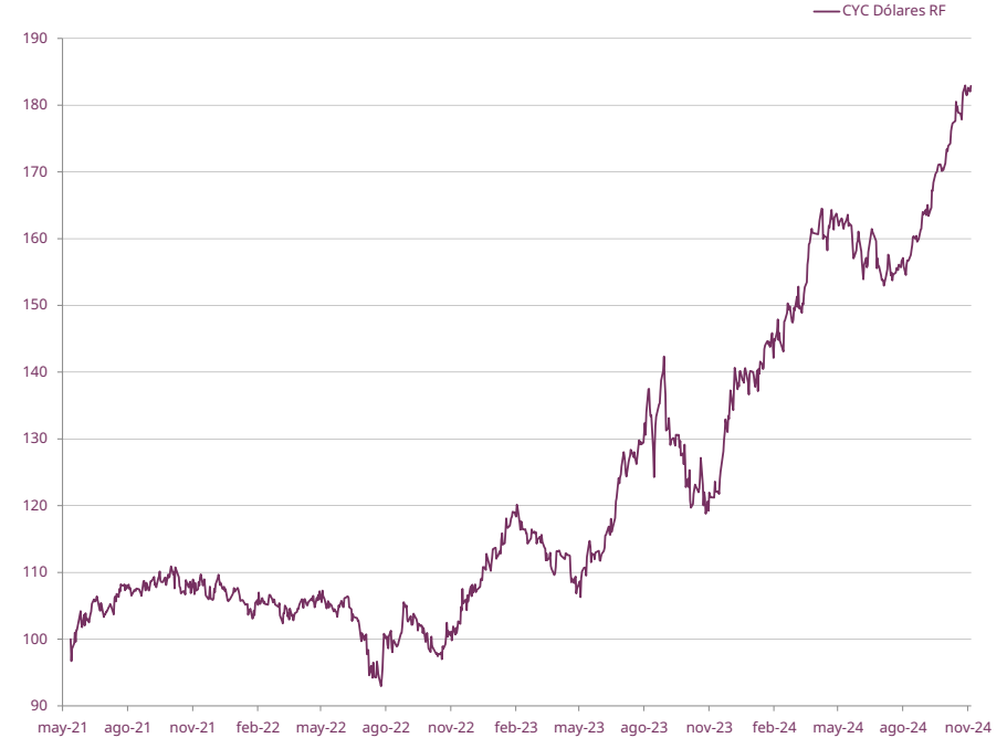
EVOLUCIÓN DE CUOTAPARTE DESDE INICIO